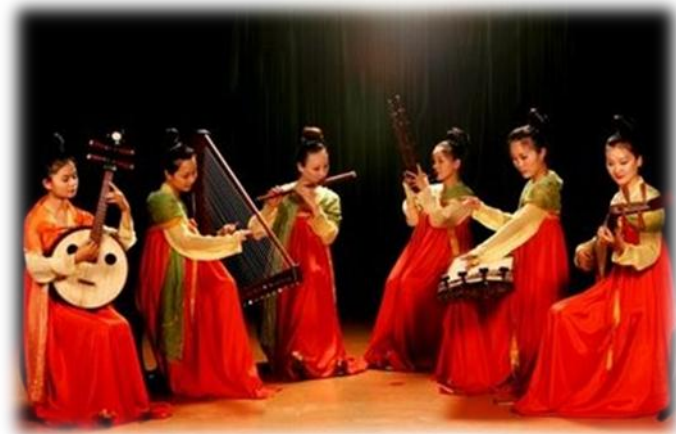
Fig.18 Música tradicional Chinesa

A presença da música na China é anterior ao surgimento da civilização chinesa e documentos e artefatos fornecem evidências de uma cultura musical bem desenvolvida ainda na Dinastia Zhou (1122 AC - 256 AC).