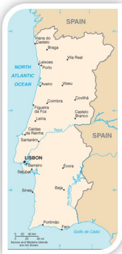
Fig.1 Mapa de Portugal

Portugal, oficialmente República Portuguesa, é um país localizado no sudoeste da Europa, cujo território se situa na zona ocidental da Península Ibérica e em arquipélagos no Atlântico Norte. Possui uma área total de 92 090 km 2 , e é a nação mais ocidental do continente europeu. O território português é delimitado a Norte e a Leste por Espanha e a Sul e Oeste pelo Oceano Atlântico, e compreende a parte continental e as regiões autónomas: os arquipélagos dos Açores e da Madeira.