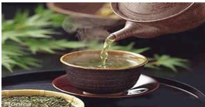
Fig. 17 Chá chinês