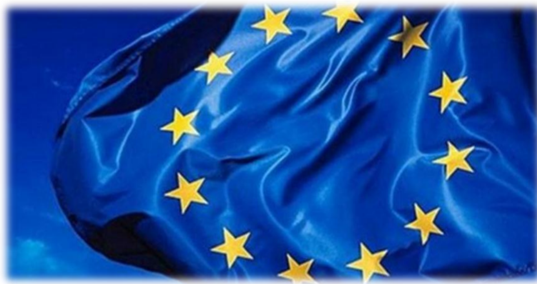
Fig. 3 Bandeira da União Europeia

de assinatura do Tratado de Lisboa. Sendo uma República Parlamentar, actualmente o Presidente da República é Aníbal Cavaco Silva e o Primeiro-ministro José Sócrates.