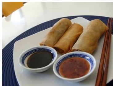
Fig. 16 Comida chinesa

A comida chinesa é diferente da comida ocidental onde a proteína da carne é o prato principal de uma refeição.