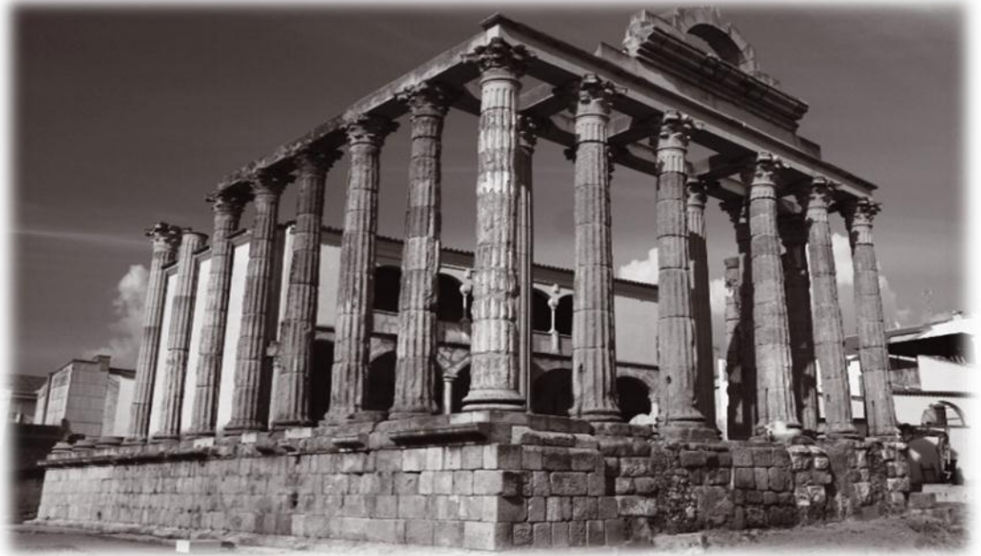
Fig. 4 Templo de Diana em Évora

A arquitectura portuguesa é baseada num passado que remonta aos tempos pré-históricos das invasões dos Romanos e Mouros. Todos eles deixaram as suas marcas, deixando uma rica herança de ruínas arqueológicas, tais como o Templo de Diana em Évora,