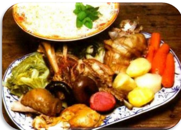
Fig. 7 Cozido à Portuguesa

A gastronomia é muito rica em variedade. Cada zona do país tem os seus pratos típicos, incluindo os mais diversificados alimentos, passando pelas carnes de gado, carneiro, porco e aves, pelos variados enchidos, pelas diversas espécies de peixe fresco e marisco (grande variedade de pratos de bacalhau). Entre os queijos sobressaem os da Serra da Estrela, de Azeitão e de São