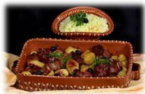
a Vitela à Vouga