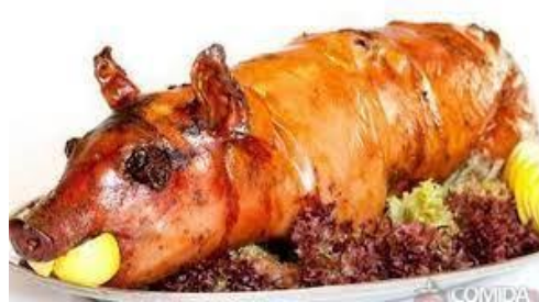
Leitão à Bairrada