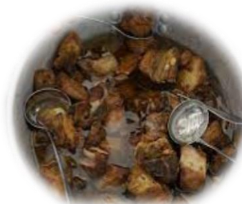
Rojões à moda da Bairrada