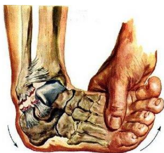
D – ENTORSE