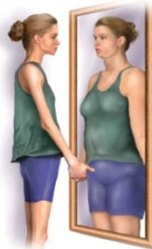
F – ANOREXIA