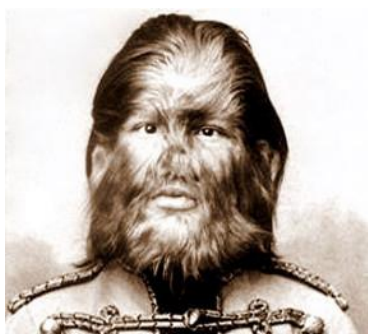
H – HIPERTRICOSE