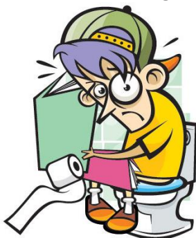
A – DIARREIA

Considera as seguintes figuras que representam determinadas situações.