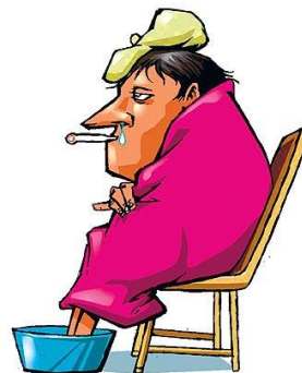
C – GRIPE