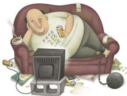
B – OBESIDADE