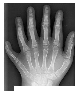
J – POLIDACTILIA

1.1. Partilha com a turma a tua resposta.