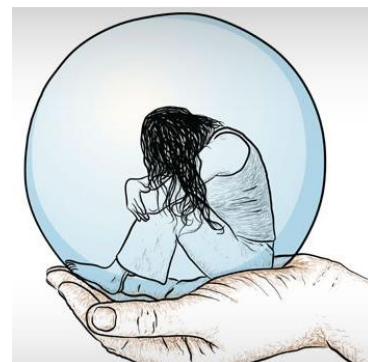
I - DEPRESSÃO