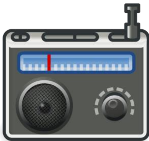
3 - Radio