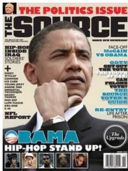
6 - Magazine