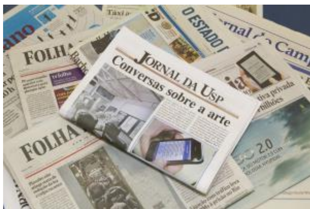
4 - Jornal