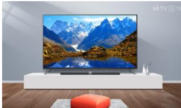
5 - TV